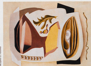
Méandre et Corde (1933). Fortement impressionné par Braque, Picasso et Léger, Hans Erni s'est essayé à l'art abstrait. Il a créé plusieurs œuvres qui ont été exposées à Lucerne sous le thème «Thèse, Antithèse, Synthèse», avant de se tourner vers d'autres formes artistiques.