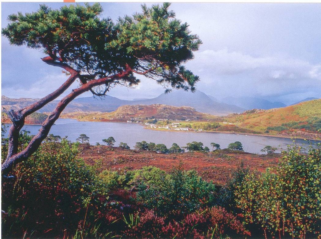
Le village de pêcheur de Shielaig sur le lac du même nom.