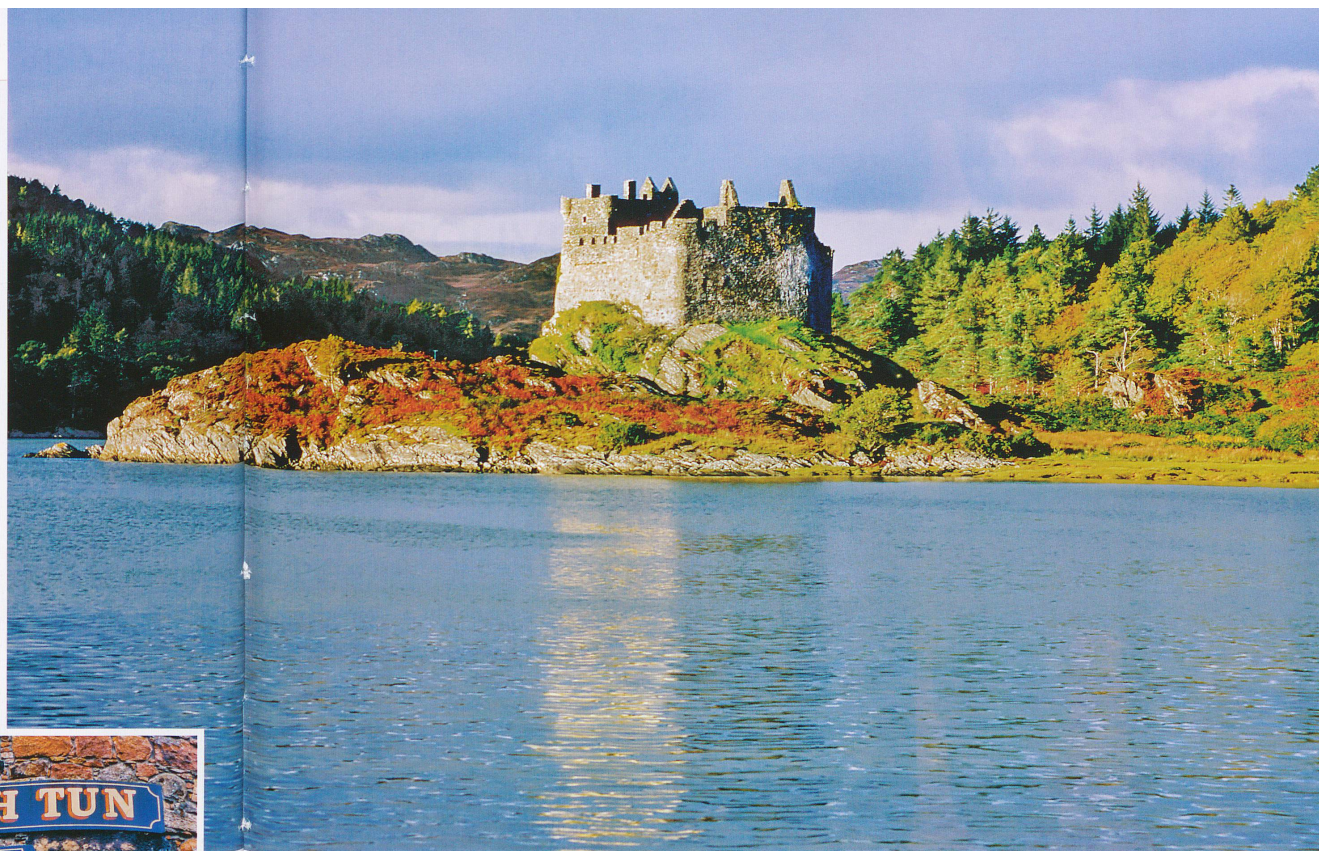
Le château de Doirin surplombe le lac Moidart.

Pour terminer ce rapide survol des outils culturels indispensables au voyage en Ecosse, nous dirons que l'inventeur du téléphone, écossais lui aussi, se nomme Alexander Graham Bell. D'où l'expression : to ring the Bell! (sonner la cloche). Avant de boucler le coffre de ma voiture, j'ai pris mes deux MacIntosh, l'imperméable et l'ordinateur portable, et mon permis de conduire à gauche. Un peu plus,