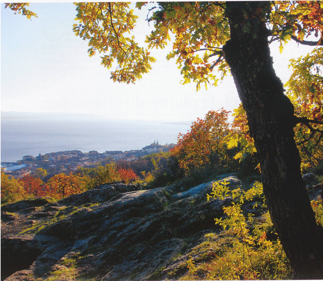
La vue sur la ville est imprenable depuis la Roche de l'Ermitage.

Le vallon de l'Ermitage se situe sur les hauts de la ville, entre la gare et la forêt. Nous l'avons parcouru avec Julien Perrot, un passionné de nature, qui nous a fait découvrir des trésors à chaque pas.