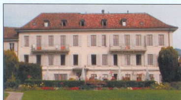
Nouvelle Roseraie - St-Légier (VD) 480 m