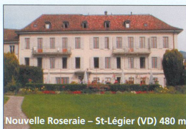
Nouvelle Roseraie - St-Légier (VD) 480 m