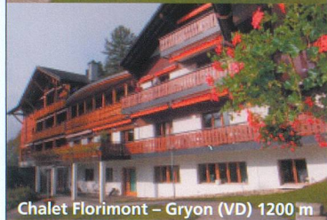
Chalet Florimont - Gryon (VD) 1200 m