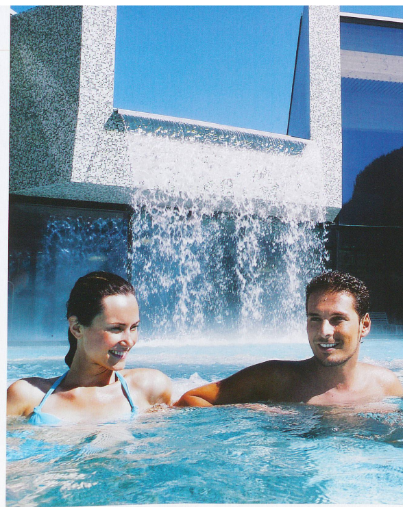
Les Bains de la Gruyère

Inaugurés il y a moins d'un an, les Bains de la Gruyère ont conquis les Romands.