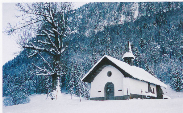
La chapelle Saint-François d'Assise de la Monse. Sortie d'un livre de contes?

Renseignements: Office du tourisme, au centre du village, tél. 026 927 55 80. Très accueillants et serviables.