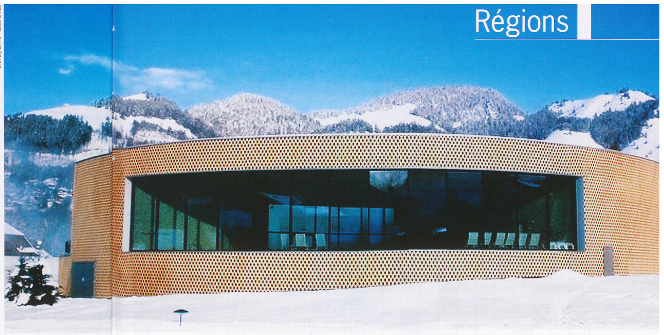
Le cylindre des Bains de Charmey s'intègre étrangement bien au pâturage.

La région est réputée auprès des parapentistes et de leurs admirateurs.