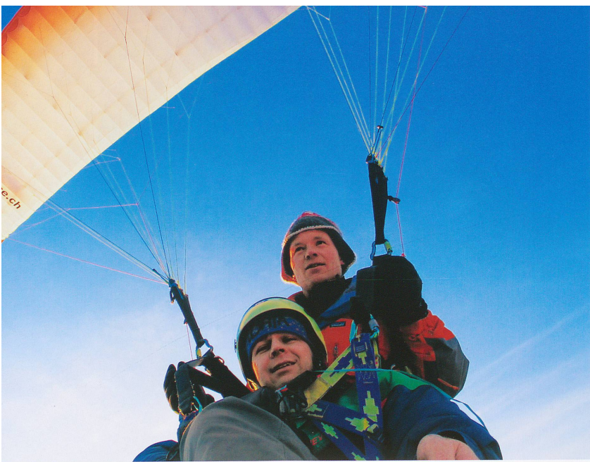
Overney & Fils - Bulle et Mar Eric Fokkes, www.charmey.org