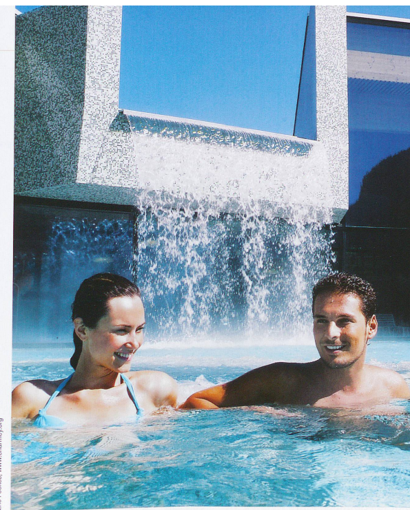
Les Bains de la Gruyère

Inaugurés il y a moins d'un an, les Bains de la Gruyère ont conquis les Romands.