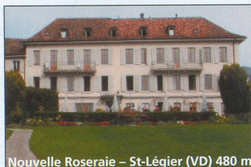
Nouvelle Roseraie - St-Légier (VD) 480 m