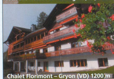
Chalet Florimont - Gryon (VD) 1200 m