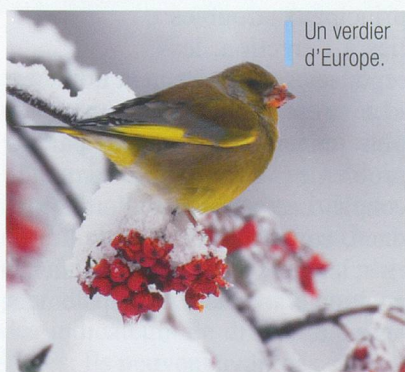
Un verdier d'Europe.

sur notre sol y est soigneusement décrit, de l'alouette lulu au troglodyte mignon, de la foulque au pouillot... Cette bible de 4,8 kilos et plus de 2000 photos décrit 419 espèces répertoriées en Suisse, leurs mœurs, leur chant, leur habitat. Il a fallu plus de dix ans de travail acharné pour mettre au point cette magnifique encyclopédie.