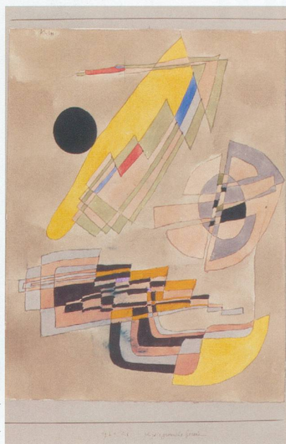
Genèse physiologique, Paul Klee, 1929

le Jardin des merveilles et le Paradis perdu. Le premier volet fait la part belle à la création et dresse des parallèles étonnants entre les artistes et les scientifiques. Le deuxième sera dédié à la croissances et à la morphologie des plantes qui ont tant fasciné Paul Klee. Le dernier évoquera l'ange qui déploie ses ailes et s'éloigne vers le passé. Une trilogie prometteuse.