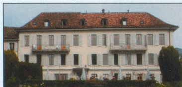
Nouvelle Roseraie - St-Légier (VD) 480 m