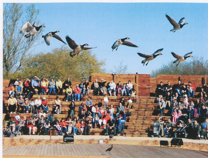
Le spectacle dans l'arène de bois permet d'observer les oiseaux en vol.