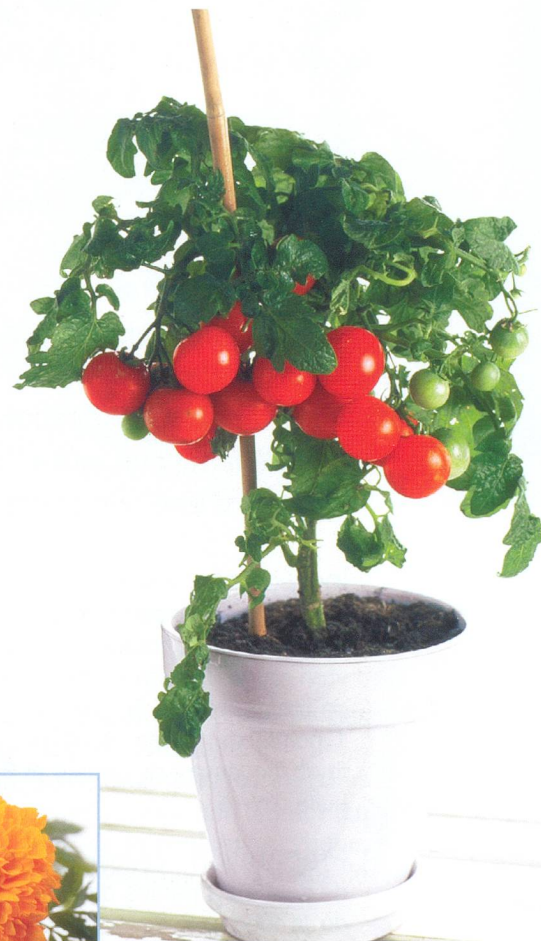
Mariez-les! Tomates et tagètes feront bon ménage dans le même pot.

duction de fraises. Les stolons servent également à la multiplication des fraisiers. Conseil: favoriser la croissance