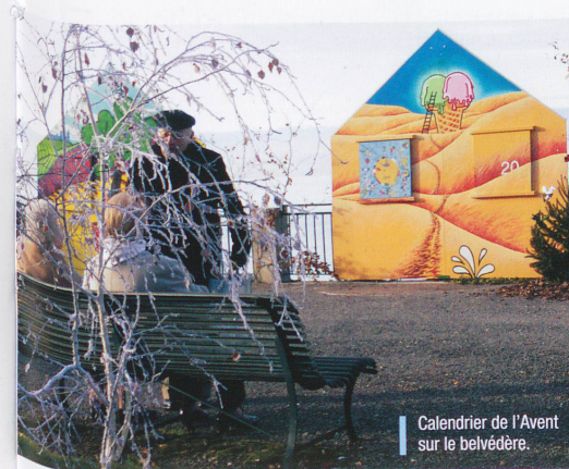
Calendrier de l'Avent sur le belvédère.

deux pas de cette terrasse, l'Office du tourisme a pris ses nouveaux quartiers dans le Château de Sonnaz qui abrite également le Musée du Chablais. Malheureusement, les collections ne sont pas visibles en ce mois de décembre, car le musée est en réfection. Il faudra donc remettre la visite – notamment de la salle consacrée aux objets de contrebande par le lac et la monta-