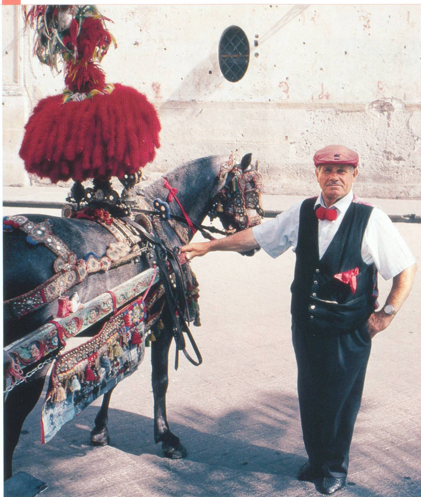
Les calèches de Monreale ne sont pas utilisées que pour les touristes.