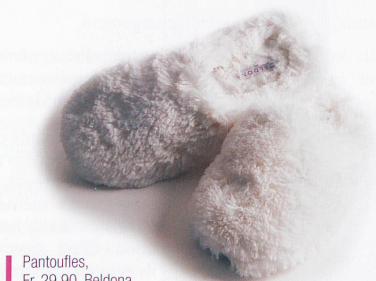
Pantoufles, Fr. 29.90, Beldona.

Pas de doute, novembre s'installe. Les jours deviennent plus courts, les nuits plus froides. On apprécie d'autant plus son chez-soi lorsqu'on s'est créé une atmosphère chaleureuse.