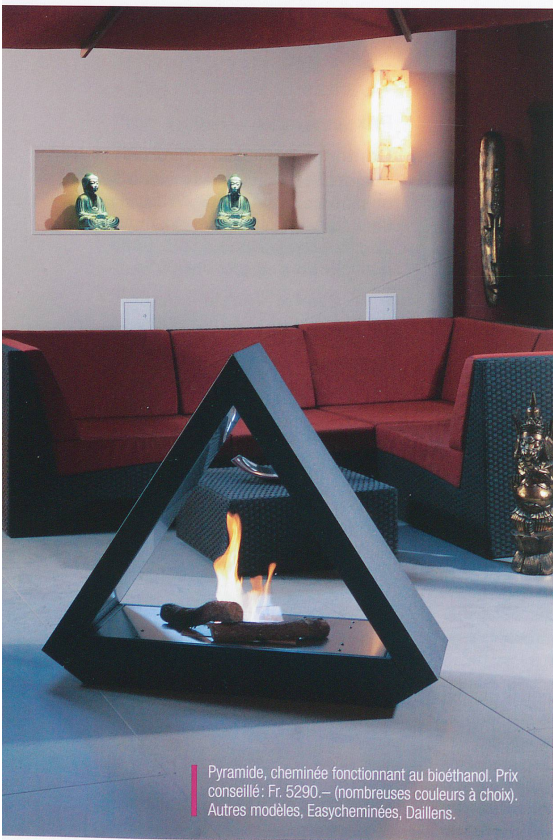
Pyramide, cheminée fonctionnant au bioéthanol. Prix conseillé : Fr. 5290.- (nombreuses couleurs à choix). Autres modèles, Easycheminées, Dailiens.

Tout le monde n'a pas la chance d'avoir une cheminée dans son appartement. Mais aujourd'hui, une nouvelle génération de foyers fait son apparition. Sans conduit, sans bois et sans fumée, ces cheminées fonctionnent au bioéthanol, donc une énergie propre et bon marché (env. Fr. 4,90, le litre). Non seulement, ces cheminées sont écologiques et décoratives, car conçues par de grands designers, mais en plus elles chauffent. Elles offrent ainsi une bonne solution de chauffage d'appoint aux entre-saisons. Ce type de cheminée est en outre facile d'utilisation : on l'allume et on l'é-