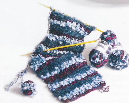
Echarpe à tricoter, Fil polyamide et acryl, Saltado, Schachenmayr nomotta, en vente chez Coop-City, Fr. 6.90