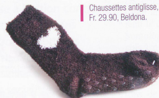
Chaussettes antiglisse, Fr. 29.90, Beldona.