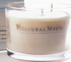
Bougie, au parfum ressourçant, Fr. 94.90, Globus.