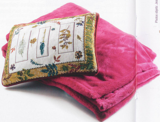
Plaid en laine polaire, couleur fuchsia, Fr. 168.-, Petit coussin (23x33), motif herbier Fr. 29.-, Bovet Tissus SA, rue Centrale 19, Lausanne.