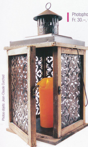
Photophore, lanterne, Fr. 30.-, Globus.