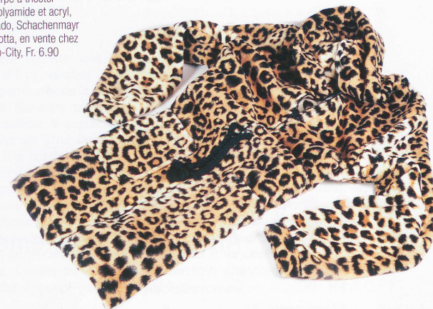
Manteau d'intérieur, fermeture à glissière et capuchon, impressions léopard, 100% polyester, Fr. 139.-, Beldona, 9 points de vente en Suisse romande.