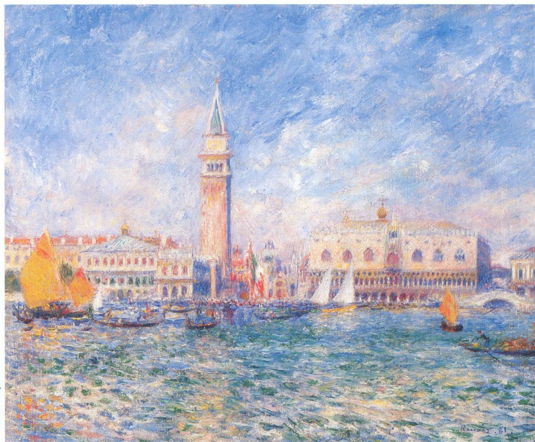
Pierre-Auguste Renoir, Vue de Venise .