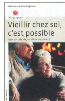
Vieillir chez soi, c'est possible, d'H.-M. Hagmann, collection Aire de famille, Saint-Augustin, 103 pages.

– En Suisse, le chiffre d'affaires des EMS est cinq fois plus grand que celui de l'aide à domicile. Pour un responsable politique, il est parfois plus payant, électoralement parlant, d'inaugurer un EMS qui a coûté cher que de développer des soins peu visibles et discrètement donnés dans l'intimité du foyer. Il importe d'attirer l'attention de chacun sur ce paradoxe. Il sera alors possible de donner une vraie priorité aux services à domicile et, ainsi, de mieux maîtriser le nombre de lits en EMS. ■