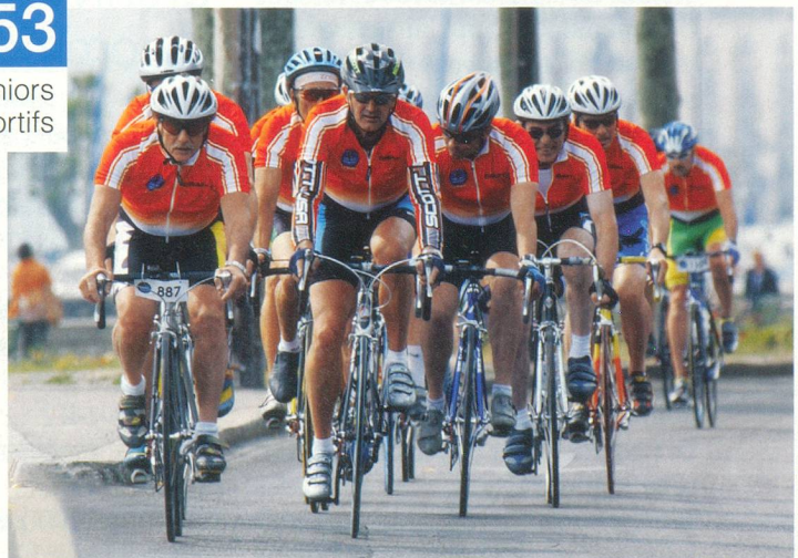
Cyclotour du Léman