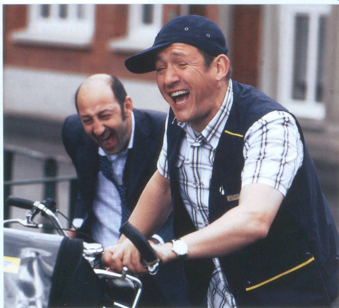
Bienvenue chez les Ch'tis, avec Kad Merad et Dany Boon.

→ dimanche 15 juin. Cité Seniors, 28, rue Amat, 1202 Genève, tél. 0800 18 19 20 (appel gratuit); www.seniors-geneve.ch