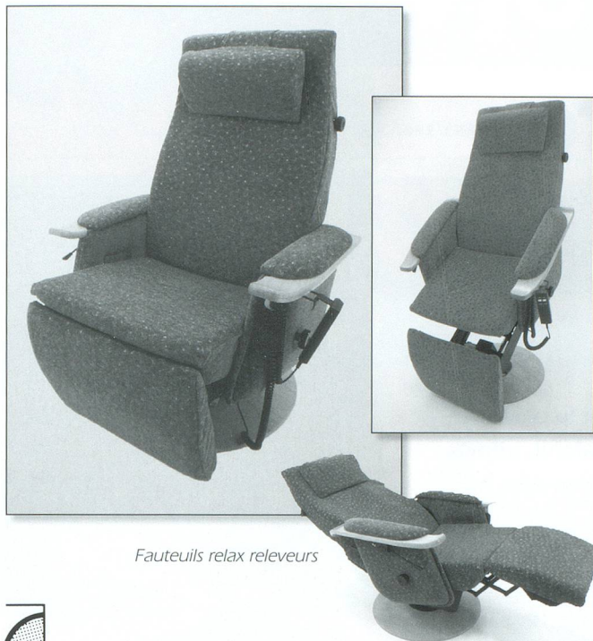
Fauteuils relax releveurs

Des professionnels au service de personnes handicapées ou âgées