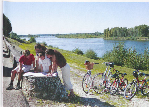
■ Près de 400 kilomètres de pistes cyclables ont été aménagés en bord de Loire.

vers l'ouest et en suivant sur une vingtaine de kilomètres le cours nonchalant du Cher par les chemins de halage, on arrive en quelques tours de roues aux grilles de Villandry. Ce château, dernier des grands châteaux de la Loire, date de la Renaissance. Il doit sa renommée à ses superbes jardins «à l'italienne». On appréciera tout particulièrement le potager décoratif. Il est composé de neuf carrés de même taille, mais comportant des motifs géométriques différents, donnant l'illusion de tapis. Chacun des carrés est planté de légumes de variétés et de couleurs différentes,