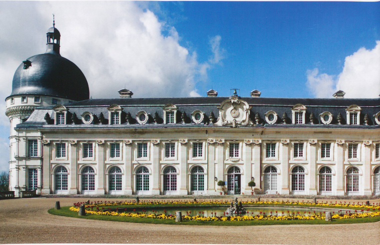
54 AVRIL 2008