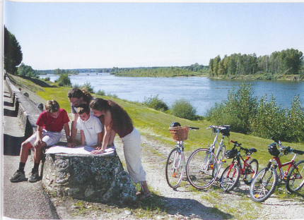
Près de 400 kilomètres de pistes cyclables ont été aménagés en bord de Loire.

Valenciay, château Renaissance où vécut Talleyrand, ministre de Napoléon.