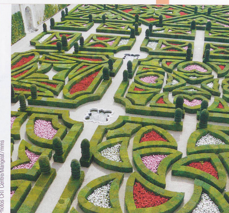
■ Les jardins extraordinaires de Villandry.

Valençay, château Renaissance où vécut Talleyrand, ministre de Napoléon.