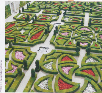
Les jardins extraordinaires de Villandry.