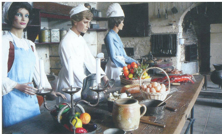
Reconstitution historique dans les cuisines de Valençay.

pour les Nuits lumière, un étonnant spectacle qui dès la tombée de la nuit, raconte sur les façades prestigieuses des principaux monuments et celles plus modestes des maisons à pans de bois des histoires de jadis. Du temps des princes, des princesses et des châteaux... ■