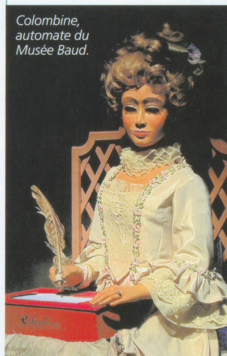
Colombine, automate du Musée Baud.

» Balcon du Jura vaudois Tourisme, Hôtel de Ville, Rue Neuve 10, Sainte-Croix, tél. 024 455 41 42; www.sainte-croix.ch