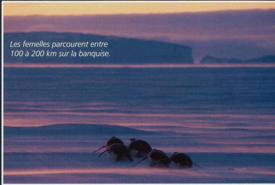
Les femelles parcourent entre 100 à 200 km sur la banquise.