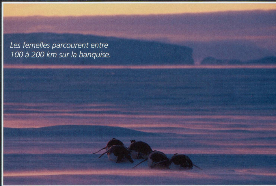
Les femelles parcourent entre 100 à 200 km sur la banquise.