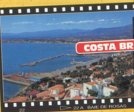
COSTA BRAVA - ESPAGNE