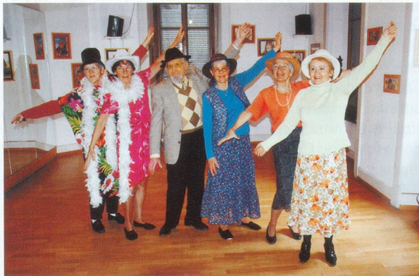
De Fil en Aiguille , spectacle de l'Atelier théâtre de Pro Senectute. Salle de la Laiterie du Bourg, à Martigny-Bourg, mardi 6 mars à 14 h; jeudi 8 mars à 19 h 30. Réservation obligatoire auprès de l'Office du tourisme de Martigny, tél. 027 720 49 49.