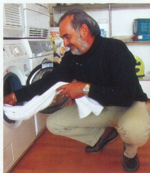
A Fribourg, Pro Senectute organise des cours de lessive pour messieurs.

MOUVEMENT DES AÎNÉS (MDA) – La section fribourgeoise du MDA fête son 20 e anniversaire. Une manifestation est prévue le 12 décembre 2007 avec animation par la chorale, le mini-orchestre de chambre, le groupe de danse, le Théâtre des 4 Heures et les conteuses. Autres activités, rends. 026 424 45 02 ou 026 402 80 64.