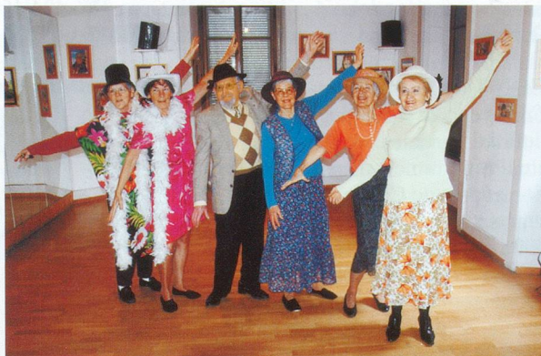
De Fil en Aiguille , spectacle de l'Atelier théâtre de Pro Senectute. Salle de la Laiterie du Bourg, à Martigny-Bourg, mardi 6 mars à 14 h; jeudi 8 mars à 19 h 30. Réservation obligatoire auprès de l'Office du tourisme de Martigny, tél. 027 720 49 49.