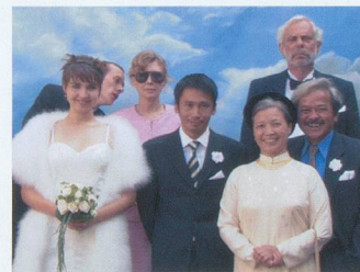
Mon frère se marie , film de Jean-Stéphane Bron.

– Mon frère se marie , de Jean-Stéphane Bron (2006), avec J.-L. Bideau et Aurore Clément, lundi 3 septembre. L'Armée des Ombres , de J.-P. Melville (1969), avec Lino Ventura, Simone Signoret et J.-P. Cassel, lundi 17 septembre. Molière , de Laurent Tirard (2006) avec Romain Duris, Fabrice Luchini, Laura Morante, lundi 24