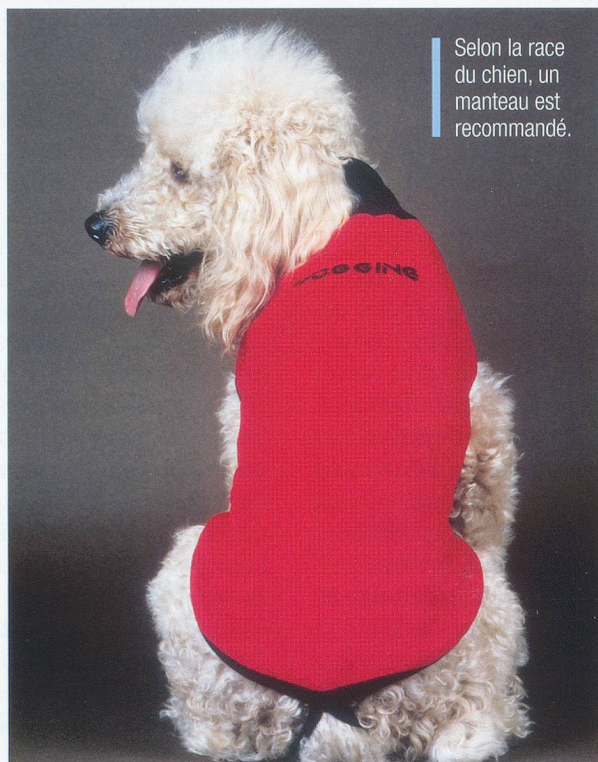
Selon la race du chien, un manteau est recommandé.

(Tiré de : Des vétérinaires répondent à vos questions , Editions Favre, d'après l'émission de la Radio Suisse Romande.)