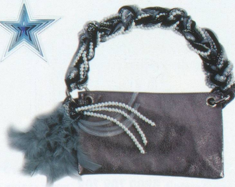
Pochette en peau laquée poignée en perles, se porte aussi en bandoulière. Création Kontessa, Fr. 139.— chez Banfi, Pully.

Adresses: A Propos , Langallerie 4, Lausanne, tél. 021 312 87 04. Hohlstr. 201, Zurich, tél. 044 242 36 56. Rosael , rue de la Louve 3, Lausanne, tél. 078 882 50 11. Cité 19 , adresse identique, tél. 022 310 56 46. Rouge de Honte , rue Caroline 5, Lausanne, tél. 021 312 85 15. On Stage , rue Saint Victor 11, Carouge, tél. 022 343 02 93. Enthésis , rue des Fosses 10, Morges, tél. 021 801 52 97. Accessoirement , rue Marterey 74, Lausanne, tél. 021 311 90 74. Lorette , rue de Bourg 11, Lausanne, tél. 021 323 53 71. Cours de Rive 13, Genève, tél. 022 735 83 30. Globus , Genève, Lausanne, Neuchâtel. Swarovski , rue de Bourg 10, Lausanne, tél. 021 351 50 55. Rue du Marché 7 Genève, tél. 022 310 88 11. Banfi , Grand-Rue 10, Pully, tél. 021 711 23 09.