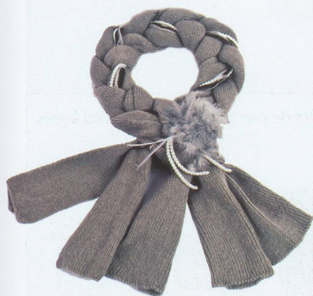
Une longue tresse douillette ornée de perles, à porter en écharpe. Fr. 139.— Kontessa, chez Banfi, Pully.