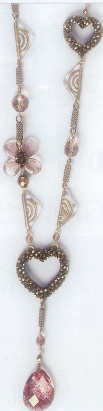
Sautoir perles métallisées et cristaux. Fr. 330.— Cité 19, Genève