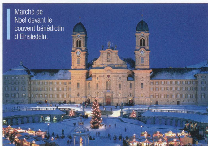
Marché de Noël devant le couvent bénédictin d'Einsiedeln.

4. Limitrophe. Deux de ces cantons touchent celui d'Uri. Quel est celui qui n'a pas de frontière avec lui? A. Berne; B. Grisons; C. Zoug.