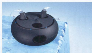
Le nouveau chargeur très esthétique peut charger deux systèmes auditifs en même temps.

ReSound Azure™ séduit par une sensation naturelle dans l'oreille. Grâce à une adaptation ouverte encore améliorée, vous n'avez plus desensations d'oreilles « bouchées ». Les effets d'obturation gênants