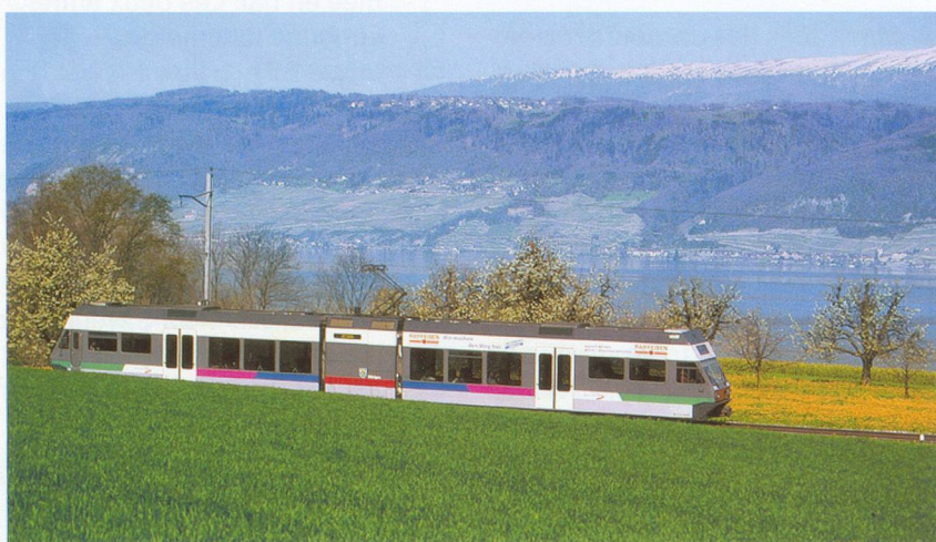
Le BTI longe la rive sud du lac de Bienne.

Les mauvaises langues l'appellent le train des choux ou des betteraves. Tout cela, parce que la ligne traverse le jardin potager du Seeland, entre Biel et Ins, pardon, entre Bienne et Anet, patrie du peintre Albert Anker.