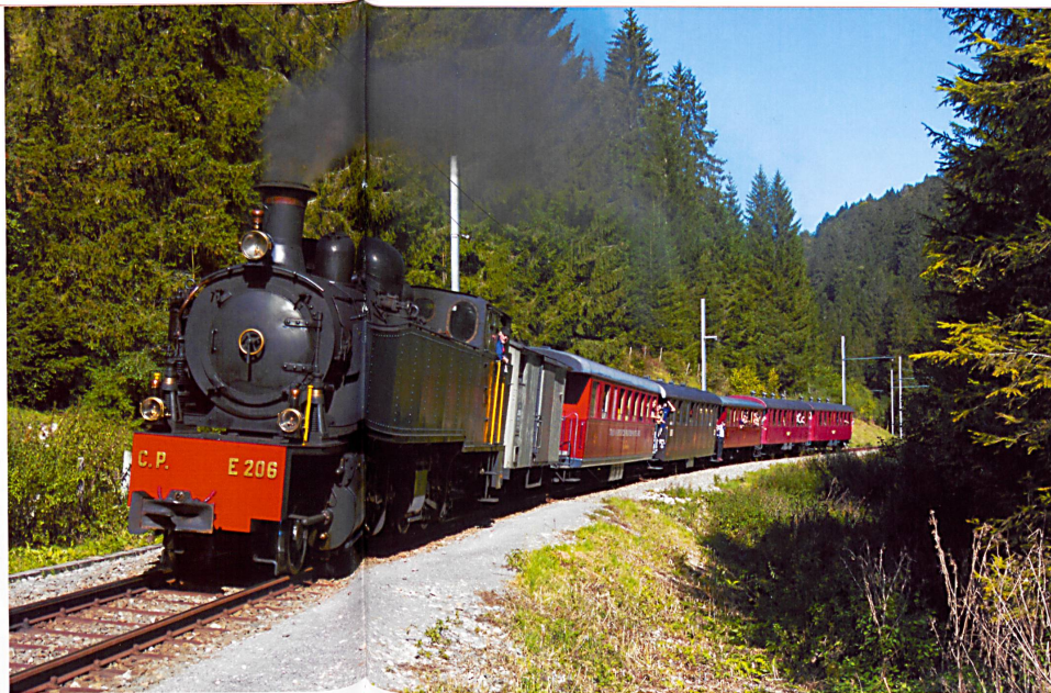
Nostalgie avec le Train à Vapeur des Franches-Montagnes.

pour une époque moins technologique, les CJ la font revivre avec la composition Belle Epoque et le