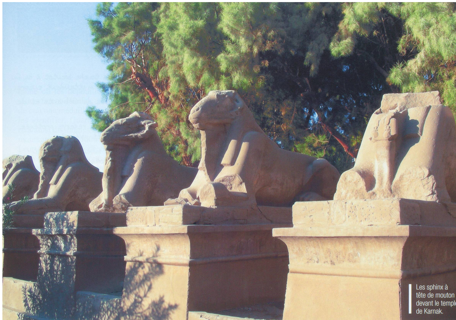
Les sphinx à tête de mouton devant le temple de Karnak.

on pénètre dans la cour éthiopienne, elle-même «gardée» par une impressionnante alignée de sphinx. Plus loin, deux statues de Ramsès III encadrent l'entrée dédiée au pharaon. Le colosse de Pinedjem, pharaon de la 21 e dynastie se dresse à quelques pas de là. Curieusement, une petite statue féminine a été sculptée à ses pieds.