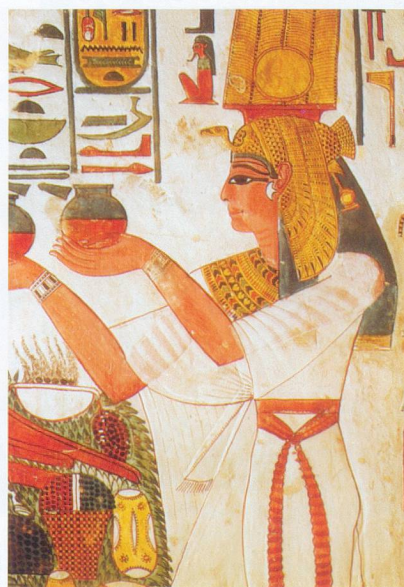
La reine Néfertari était d'une grande beauté.

La légende dit que les tombeaux des pharaons étaient creusés par