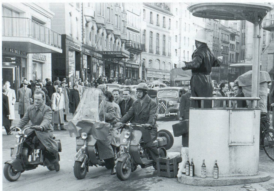
Lausanne, place Saint-François; les étrennes des policiers en 1953.