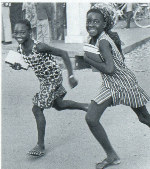
Deux fillettes dans les rues de Ouagadougou en 1973.