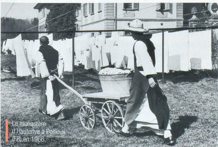
Le monastère d'Hauterive à Postieux (FR) en 1966.