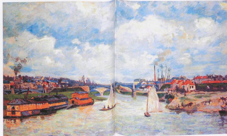
La Seine à Charenton d'Armand Guillaumin, dernier survivant de l'impressionnisme.

Cézanne, Renoir, Sisley et Bazille. Ce sont eux, étudiant dans l'atelier du peintre suisse Charles Gleyres, qui constituèrent le noyau central du mouvement. Caillebotte, Degas et Manet rejoignirent ensuite le groupe. Plus quelques jeunes peintres amateurs inconnus à l'époque, qui avaient pour nom Paul Gauguin (élève de Pissarro) et Vincent Van Gogh, qui intégra le mouvement dès son arrivée à Paris en 1886.