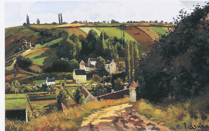
La Côte du Jallais, à Pontoise, par Camille Pissarro.

Reste de cette période de douze années de bouillonnement artistique des œuvres