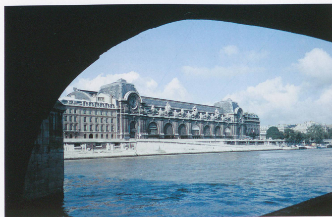
Le Musée d'Orsay, a été créé dans l'ancienne gare désaffectée.