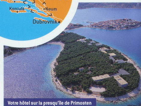
Votre hôtel sur la presqu'île de Primosten

7è jour/lun, Dubrovnik: Découverte de Dubrovnik, la « perle de l'Adriatique », l'une des plus importantes villes historiques de toute la Méditerranée. Le pont-levis sur les remparts moyenâgeux de la vieille ville, vous transportera soudain à l'âge d'or de la Renaissance.