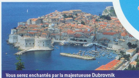
Vous serez enchantés par la majestueuse Dubrovnik