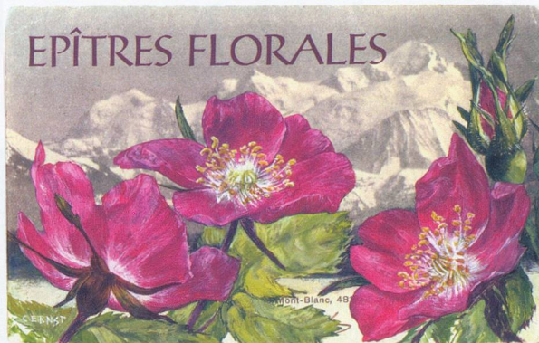
MICHEL BUTOR CATHERINE ERNST EDITIONS SLATKINE