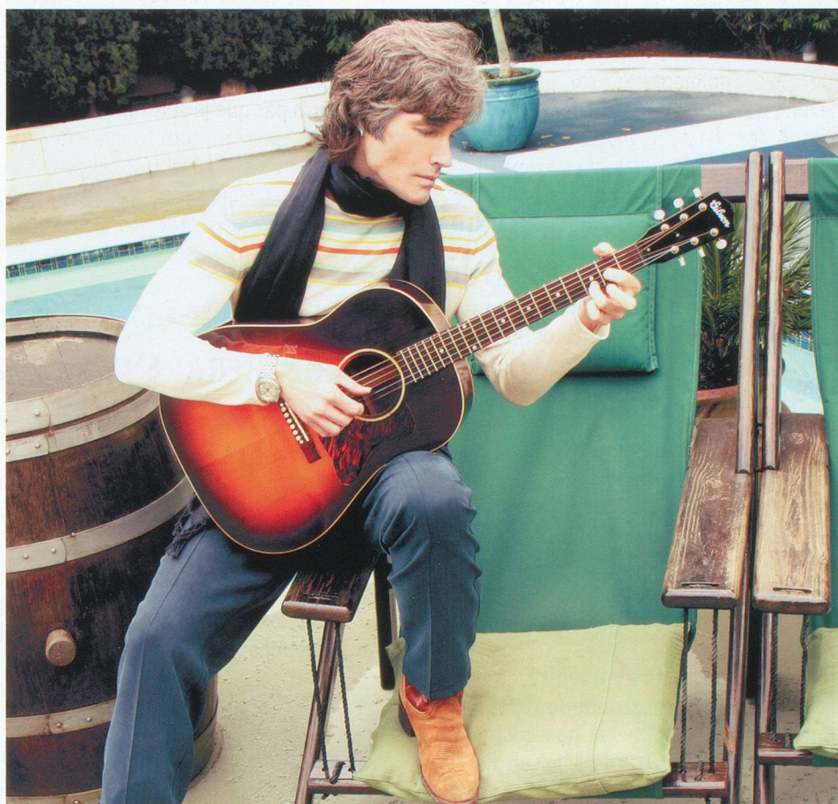
Lorsqu'il ne tourne pas, il parcourt le monde avec sa guitare et son groupe Player.

– Mes journées commencent toujours très tôt. Il n'est pas rare que je me lève à cinq heures pour être le premier sur le plateau. Comme nous tournons un épisode par jour, il arrive que j'aie plusieurs dizaines de pages de dialogues à apprendre. C'est devenu une routine au fil des années. La force de Top Models réside dans son équipe d'ac-