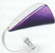
Delta Dimension originale

Oticon Delta est un système auditif super léger au design révolutionnaire et à la qualité acoustique exceptionnelle. Il a été spécialement conçu pour des gens et des situations où il est particulièrement difficile, non seulement d'entendre mais surtout de comprendre clairement ses interlocuteurs.