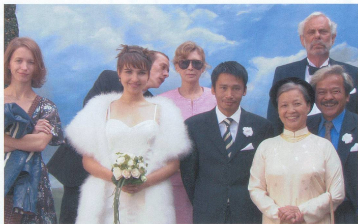
Mon Frère se marie , première fiction de Jean-Stéphane Bron.

Avec Mon Frère se marie , le jeune réalisateur vaudois Jean-Stéphane Bron signe ici sa pre-