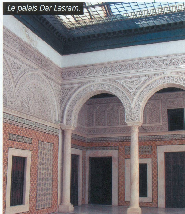
Le palais Dar Lasram.