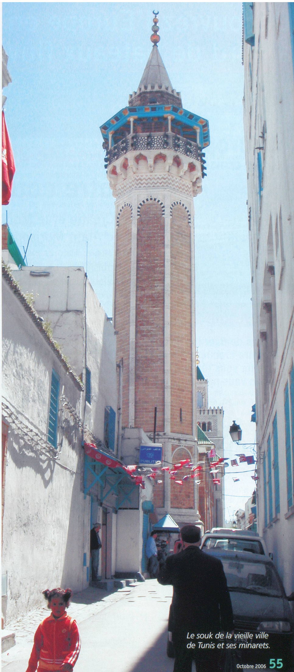
Le souk de la vieille ville de Tunis et ses minarets.