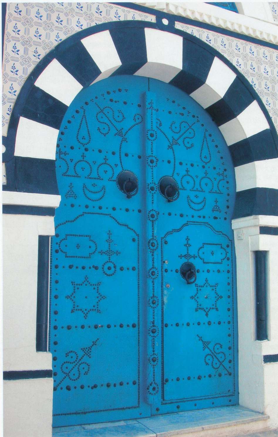
A Sidi Bou Saïd, à quelques kilomètres de Tunis, le bleu règne en maître.

Méconnue, la capitale tunisienne a pour rivale les plages et le désert, fréquentés assidûment par les touristes. La ville recèle pourtant des merveilles que les Tunisiens cherchent aujourd'hui à mettre en valeur. Balade dans une cité vivante.