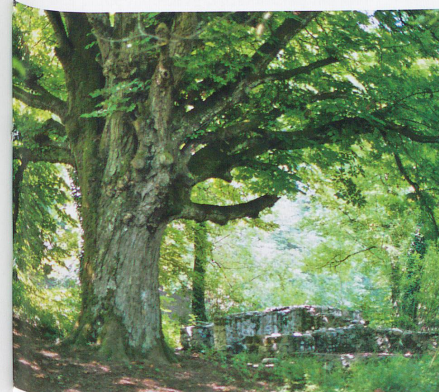
A l'ombre d'un somptueux marronnier.