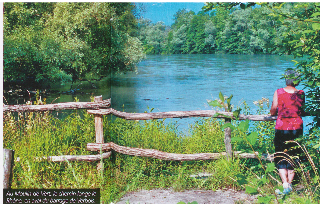
Au Moulin-de-Vert, le chemin longe le Rhône, en aval du barrage de Verbois.

ché en une réserve naturelle. Au fil des décennies, le fameux Moulin-de-Vert prendra peu à peu le visage qui est aujourd'hui le sien: un paradis de la faune, de la flore et des humains respectueux du lieu. Bords du Rhône, étangs, roselières, falaises, prairies, forêts, tout y est. A une vingtaine de minutes du centre-ville en voiture, les Genevois peuvent renouer avec une nature intacte, dans un espace sillonné de sentiers pédestres et parsemé d'étangs offrant divers points d'observation de la faune. La prome-