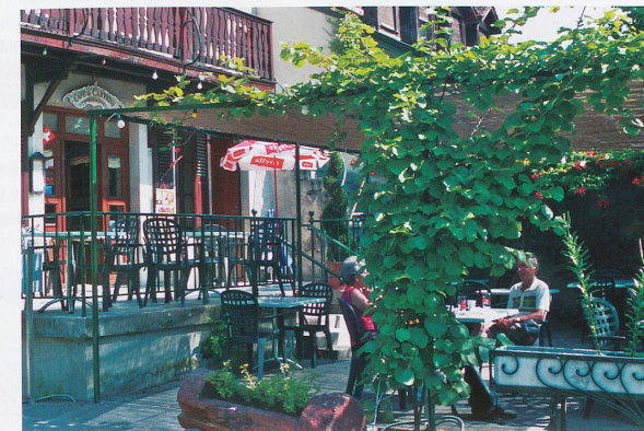
Une terrasse de rêve au Café de Cartigny.

Ensuite, si vous prenez le petit chemin qui monte à gauche, vous arriverez sur le Plateau Central, d'où vous aurez une vue sur l'Etang-des-Iles et l'Etang-Est. Nous vous suggérons plutôt de rester sur le chemin principal qui part légèrement à droite et traverse l'Etang-Ouest, vous offrant plusieurs points d'observation sur le plan d'eau et les Roches qui le surplombent.