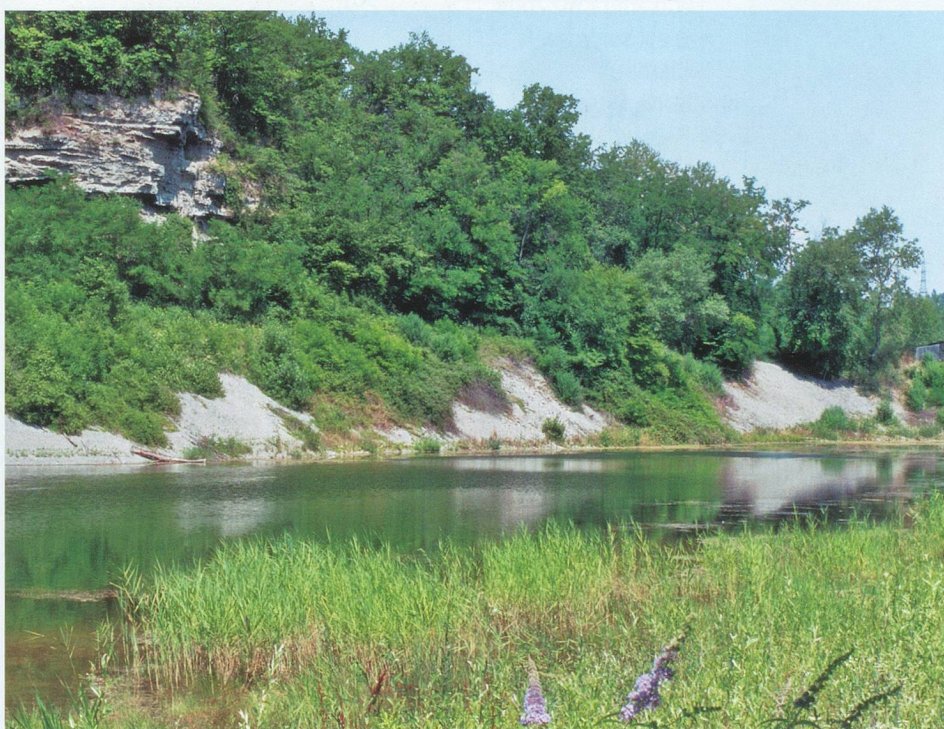
Aux Teppes, l'Étang-Paul-Géroudet, où vous apercevrez peut-être la grande aigrette.