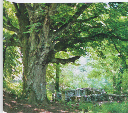
A l'ombre d'un somptueux marronnier.

En poursuivant tout droit, vous longerez à votre gauche l'Etang-des-Iles, avec un premier point d'observation: un paravent de bois muni d'ouvertures à hauteur de regard pour voir sans être vu. A peine plus loin, c'est sur le Rhône que vous aurez un point de vue magnifique. Bien que canalisé, le fleuve reprend ses allures sauvages grâce à la végétation qui le borde. Ici, l'Etang-Ouest est resté relié au Rhône. Le chemin quitte le cours du fleuve par un coude sur la gauche.