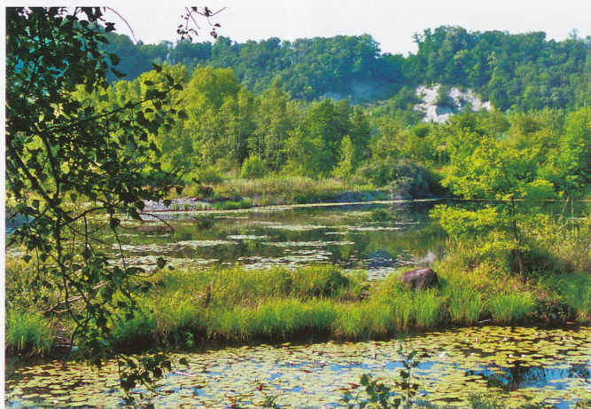
Les étangs sont le paradis des nénuphars, et des oiseaux.

reusement fleurie – pour arriver rue du Trablé où la charmante terrasse du Café de Cartigny vous attend. En repartant, retracez tout le village, sans reprendre le chemin par lequel vous êtes arrivé. Continuez jusqu'aux dernières maisons, après lesquelles vous trouverez, partant sur la gauche, le bien-nommé chemin du Moulin-de-Vert. Il descend doucement vers la réserve, en forêt, traversant l'emplacement des anciens Moulins-de-Vert datant du 15 e siècle. Sous un somptueux marronnier plus que centenaire, quelques vestiges d'une ancienne ferme rappellent l'existence de ces moulins et l'activité hydraulique qui ré-