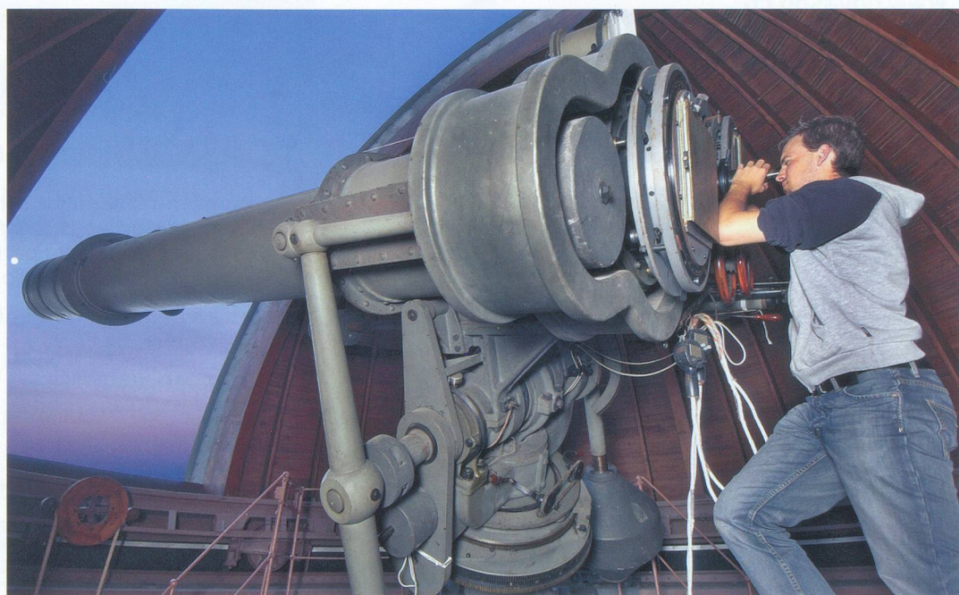
Une machinerie digne du professeur Tournesol permet de mouvoir la lunette.

La présentation terminée, on quitte la salle de théorie pour se retrouver sous la coupole en face de cet instrument imposant. La machinerie destinée à mouvoir la lunette est digne du professeur Tournesol! Mais cette