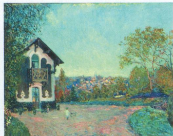
Vue de Marly-le-Roi au Cœur-Volant, Alfred Sisley.

Après la Collection Phillips et le Musée Pouchkine, c'est au tour du très prestigieux musée new-yorkais de s'inviter à Martigny. Attention, tous les tableaux exposés ne sont pas des chefs-d'œuvre et tous ne sont pas non plus l'œuvre de grands maîtres, mais ils témoignent de la fascination qu'exerçait l'art européen sur le Nouveau Monde. A la fin de la guerre de Sécession, en 1865, un groupe de riches Américains décide de créer un musée d'art à New York. C'est chose faite en 1872 avec l'ouverture du premier et encore modeste Metropolitan Museum of Art. Le Met comptait alors 174 tableaux acquis sur les marchés de Paris et de New York, et sans doute surévalués par les vendeurs. Mais qu'importe, les Etats-Unis possédaient désormais le début de ce qui deviendrait une des plus fabuleuses collections de tableaux du monde. Elle comporte aujourd'hui plus de 2500 toiles de peintres européens du 16 e au 19 e siècle, léguées au musée par des donateurs aussi généreux que riches.