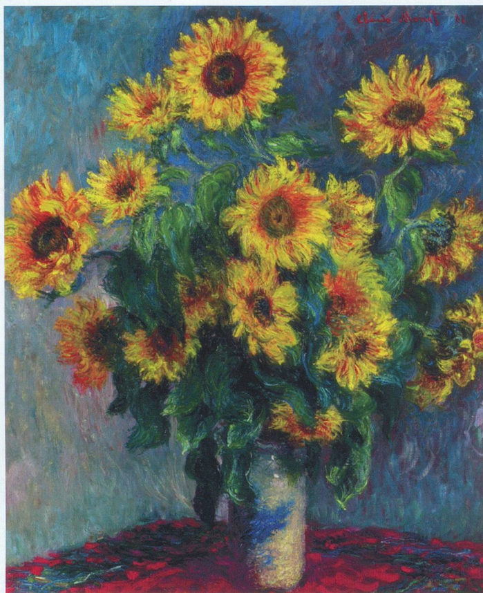
Bouquet de Tournesols, Claude Monet.

A travers 50 tableaux provenant du Metropolitan Museum of Art de New York, la Fondation Gianadda nous offre un condensé de la peinture européenne du 16 e au 19 e siècle.