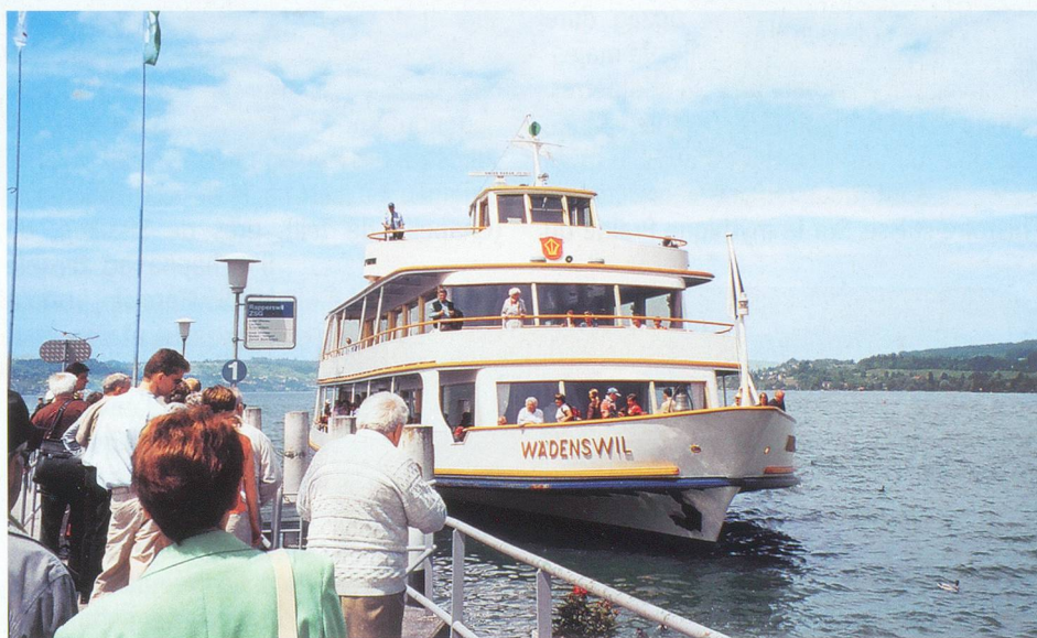
Un des bateaux du lac de Zurich arrive au port de Rapperswil.

Bateau Greif , case postale 17, 8124 Maur. M. Peter Surbeck, tél. 044 940 90 96.