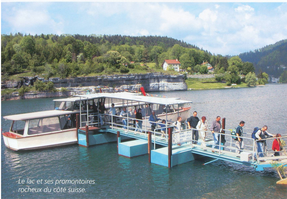
Le lac et ses promontoires rocheux du côté suisse.