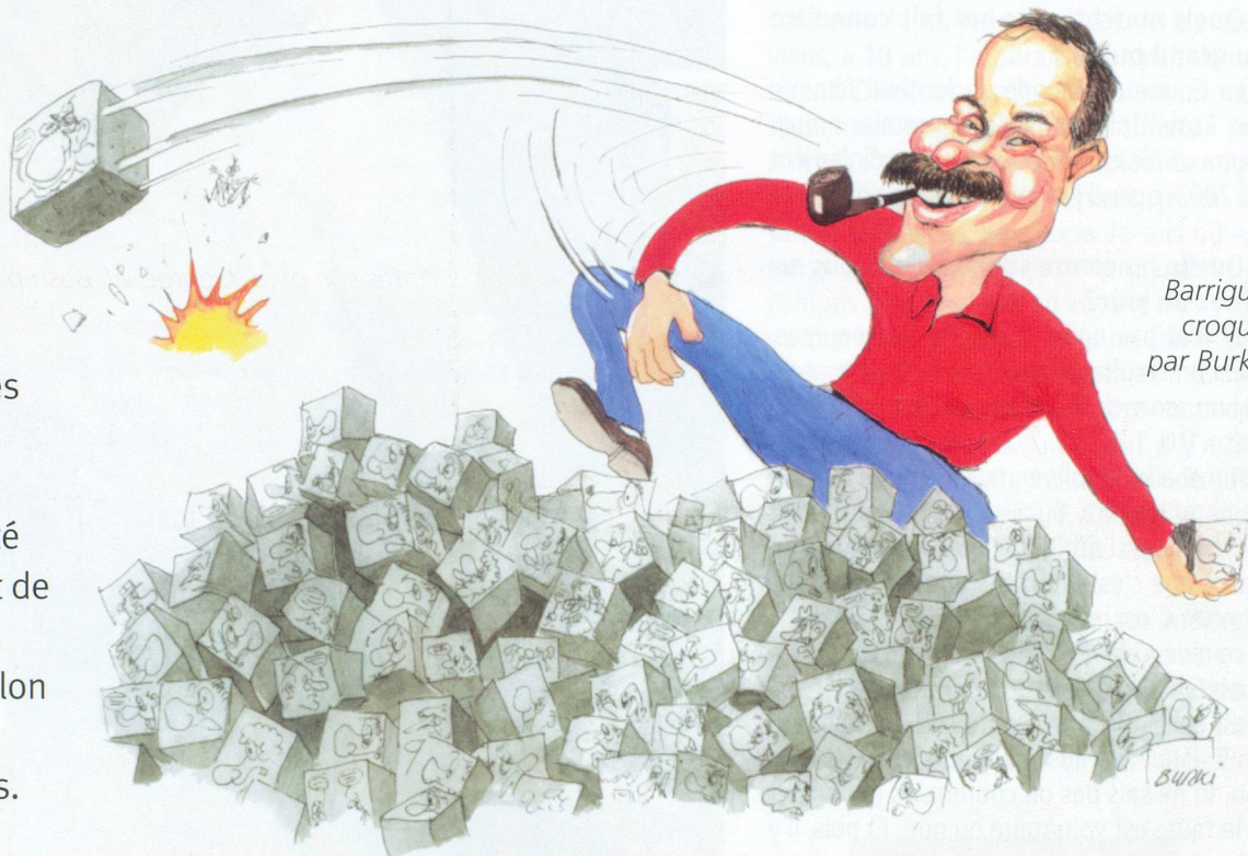
Barrigue croqué par Burki.

Le premier album des Barricatures , réunissant les dessins de Thierry Barrigue a été publié il y a un quart de siècle. L'artiste est à l'honneur lors du Salon du dessin de presse qui se tient à Morges.