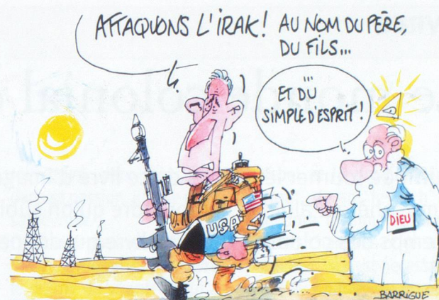
Après son père, George W. Bush part en croisade du côté de l'Irak en mars 2003.