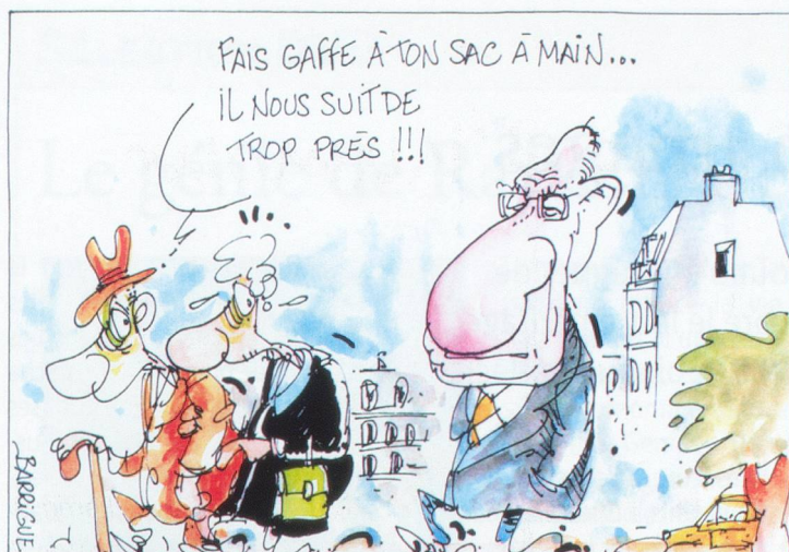
En septembre 2003, Pascal Couchepin explique son plan de financement de l'AVS.