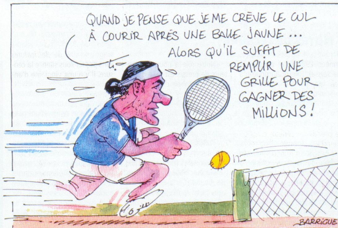
Mai 04: Roger Federer dispute Roland-Garros et la Loterie à numéros se monte à 5,7 millions de francs.

Rens. tél. 021 804 15 65 et www.morges-sous-rire.ch