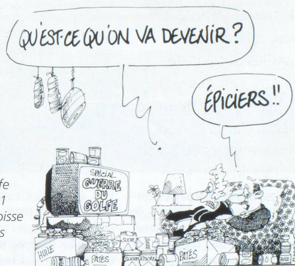
Guerre du Golfe en 1991 et angoisse dans les foyers suisses