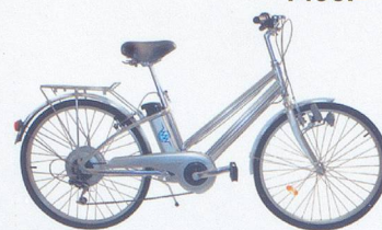
Watt-A-Bike La p'tite reine électrique