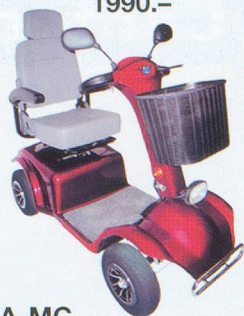
W-A-MC Voiturette électrique