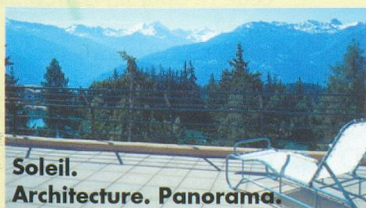
Soleil. Architecture. Panorama.

Hôtel*** Bella Lui Route du Zotset 3963 Crans-Montana