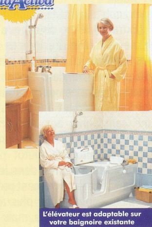
L'élévateur est adaptable sur votre baignoire existante

Pour votre sécurité et indépendance du bain: demandez notre brochure en couleurs gratuite!