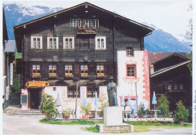
Un restaurant typique situé au cœur d'Ernen.

» Restaurant St-Georg, Ernen, tél. 027 971 11 28, fermé le mardi en juillet et août.