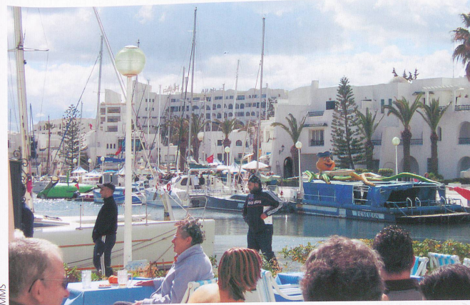
La marina de Port El-Kantaoui compte de nombreuses terrasses accueillantes.

été, il vaut mieux éviter les vacances scolaires, remarque Francine Rey, puisque certains hôtels qui comportent des centres de thalasso accueillent également des vacanciers non curistes. »