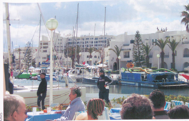
La marina de Port El-Kantaoui compte de nombreuses terrasses accueillantes.

été, il vaut mieux éviter les vacances scolaires, remarque Francine Rey, puisque certains hôtels qui comportent des centres de thalasso accueillent également des vacanciers non curistes. »