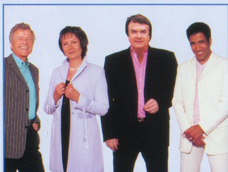
Avec Alain Morisod et Sweet People

Passez sept jours de rêve sur le Danube, de Passau à Budapest en passant par Vienne, en compagnie d'Alain Morisod et Sweet People et d'autres animateurs. Croisière à bord du MS Europe .